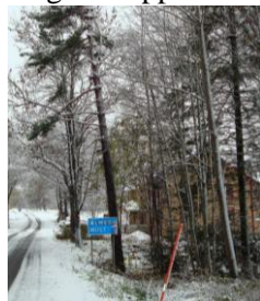
och 31 oktober