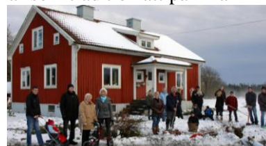
Granhult Alla helgons dag 2008