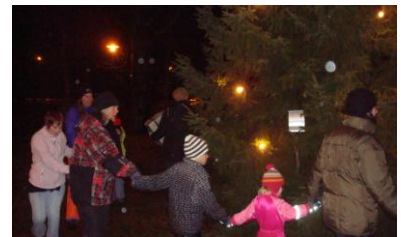
Marhult 10 januari

Lördagen 10 januari dansades julen ut i Marhult. Stämningen var mycket god trots det kalla, fuktiga vädret. För musiken stod Elisabet med sitt dragspel och sin sång. Det bjöds på denna fest, som anordnades av Kyrkans Unga under ledning av