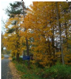
Älmeshult 18 oktober

När förra Granhultsbrevet skickades ut hade man inte en tanke på någon vinter. Hösten blev vacker och färgrik. Men den vackra hösten tog plötsligt slut 30 oktober, kl 11.15. Att jag kommer ihåg det så väl beror på att vi höll på att gräva upp våra dalier när det började regna och snöa. Vi blev tagna på sängen.