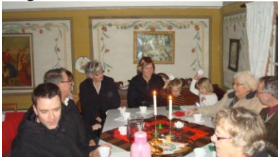
Luciafest i hembygdsgården

stugorna. Luciafesten avslutades med trevligt samkväm i hembygdsgården.